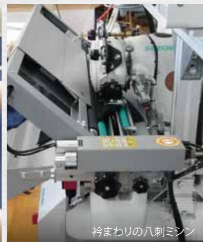
衿まわりの八刺ミシン