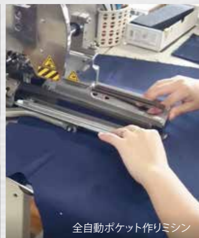
全自動ポケット作りミシン