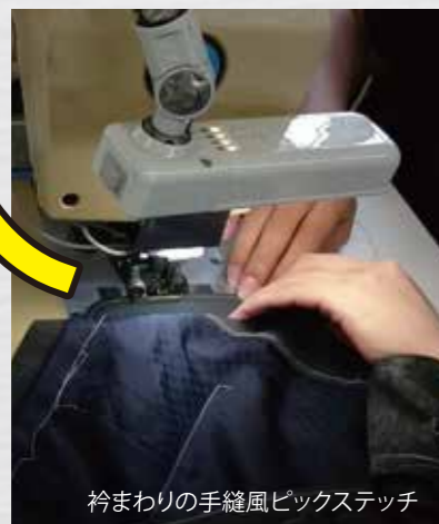
衿まわりの手縫風ピックステッチ

"1週間でハイ!どうぞ!"ではIT化IoT化により作業時間の短縮を図る一方で、縫製作業の工程数を従来の300工程から320工程へ増やし、スピードと品質の両面を向上させました。